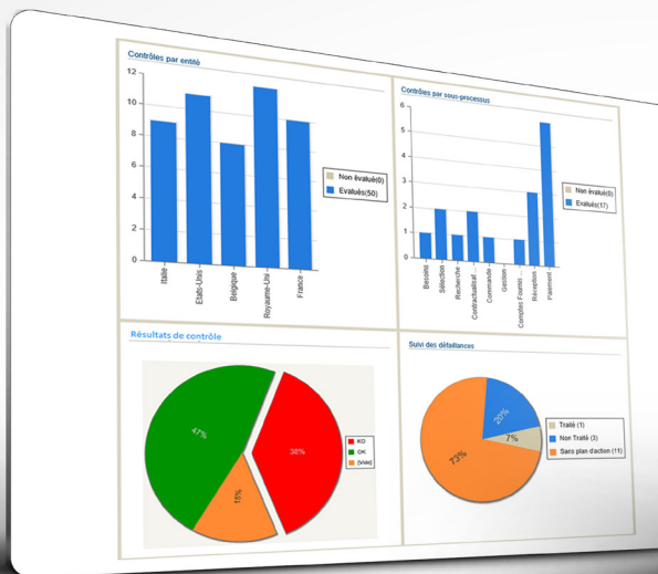
Répartition des contrôles par entités et processus